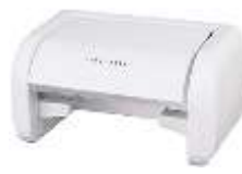
⑧トイレット ペーパーホルダー